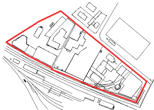
Le nouveau périmètre du PPA Industrie